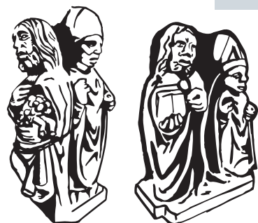
Détails des personnages latéraux

Le sommet de la croix est couronné d'une sculpture représentant Dieu le Père.